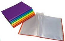
Carpeta de fundas A4 con forros.